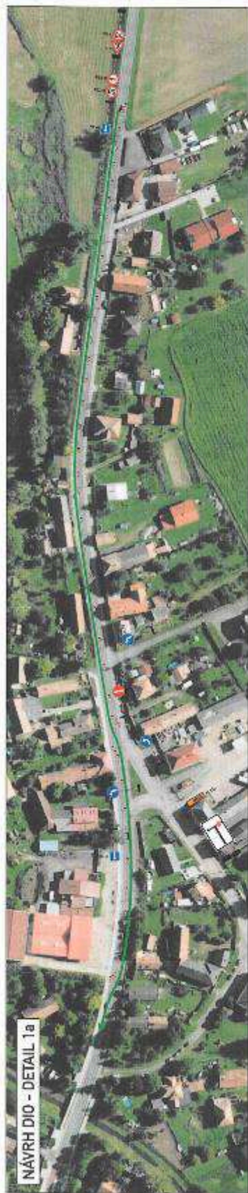
NÁVRH DIO - DETAIL 1a