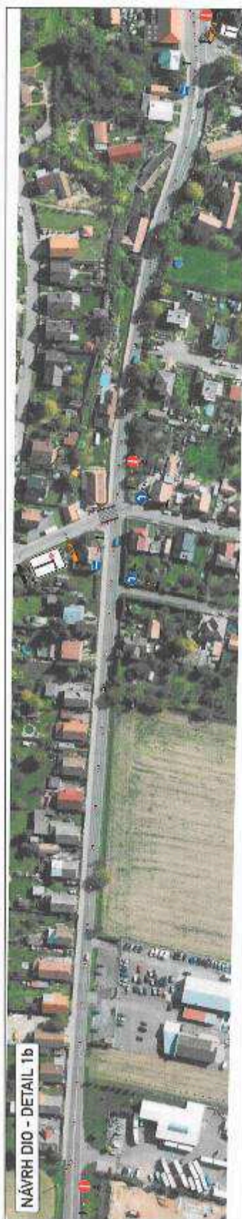
NÁVRH DIO - DETAIL 1b